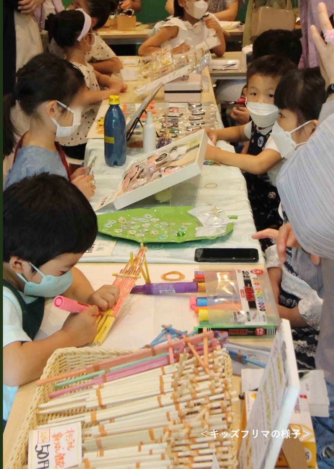
<キッズフリマの様子>